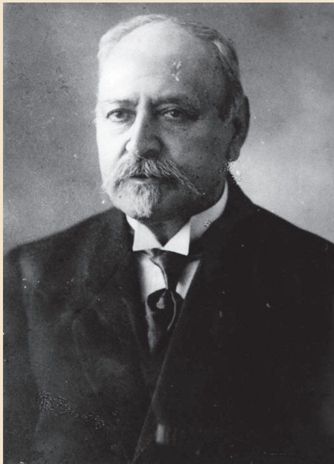
Γεώργιος Χατζιδάκις 1848-1941 Καθηγ. Γλωσσολογίας-Γραμματικός-Ίδρυτής του Λεξικού

Διημερίδα της Ελληνικής Ονοματολογικής Εταιρείας Αφιερωμένη Στη Μνήμη του Γεωργίου Ν. Χατζιδάκι (1848-1941)